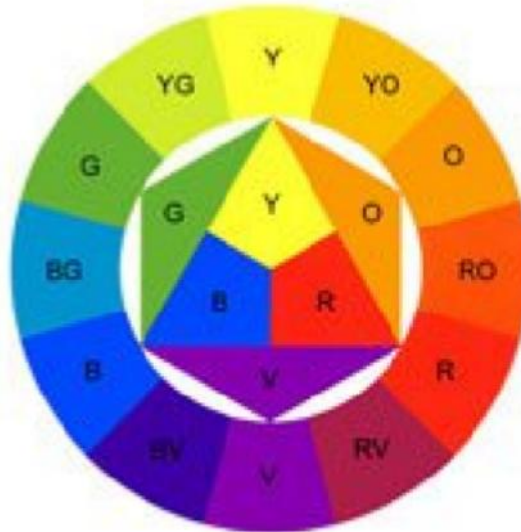
Gambar 2. Lingkaran warna oleh Itten

Penerapan skema warna secara strategis mampu merepresentasikan karakter ruang yang spesifik serta menginduksi respons psikologis tertentu. Sejalan dengan teori yang dikemukakan oleh Monica & Darmayanti (2022), penggunaan aksen kuning dalam interior hotel ini berfungsi sebagai point of interest yang menyampaikan pesan keramahan dan keceriaan. Dari sudut pandang psikologis, komponen "Yellow Thread" berfungsi sebagai penghubung sensorik yang mengubah cara pandang pengguna terhadap ruang, dari sekadar tempat fisik menjadi pengalaman spasial yang komunikatif dan bermakna.