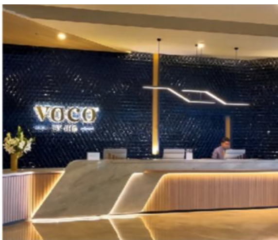
Gambar 5. Receptionist Hotel Voco Bandung

Berdasarkan hasil pengamatan, selain warna yang digunakan, faktor pencahayaan juga memberikan dampak penting terhadap suasana serta cara pengguna mengenali lingkungan interior. Selain palet netral yang dominan, terdapat pula penerapan aksentu warna bold pada beberapa bagian dinding, terutama yang berdekatan dengan area resepsionis. Aksentu warna ini berfungsi menghindari kesan monoton atau terlalu kaku pada ruang, sekaligus memberikan titik fokus visual yang menarik Gambar 4. Kehadiran warna "Yellow Thread" sebagai aksentu pada elemen interior tertentu seperti dekorasi, furnitur, dan detail ornamen pada area lobi Hotel Voco Bandung mampu memperkuat pengalaman emosional tamu dengan menghadirkan nuansa yang lebih hidup dan berkesan (Andini et al., 2025).