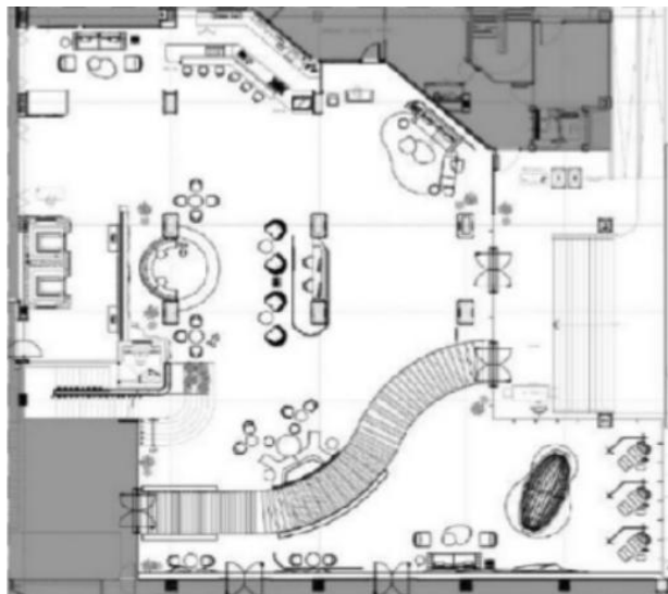
Gambar 1. Denah Eksisting lobi Hotel Voco Bandung

dirancang dengan lebih tenang dan personal untuk menyoroti konsep me time , memberikan kesempatan bagi tamu untuk beristirahat dan merasakan kedamaian. Sentuhan desain yang khas dari Bandung melalui pola dedaunan, tekstur alami, dan pemilihan material yang mendekatkan dengan lingkungan lokal menjadikan pengalaman tamu terasa lebih berkesan.