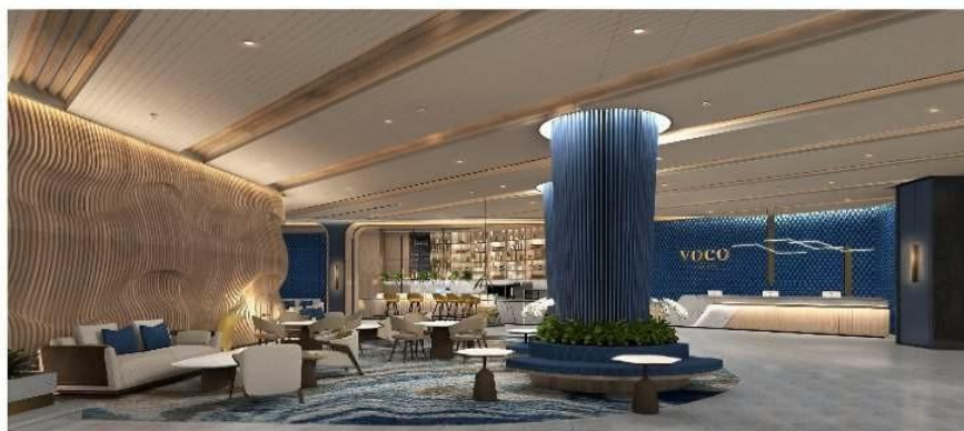
Gambar 4. Lobi Hotel Voco Bandung

Salah satu area penting di sebuah hotel adalah lobi, dengan desain bertema arsitektur modern yang menekankan kesederhanaan, ruang terbuka, dan efisiensi fungsi (Saabiq et al., 2020). Johann Wolfgang von Goethe membagi warna menjadi dua kategori utama, yaitu kuning yang berhubungan dengan kecerahan dan biru yang berhubungan dengan kegelapan. Penggunaan warna kuning yang mencolok pada bagian dalam lobi berperan sebagai elemen yang menambah semangat, kehangatan, dan nuansa bersahabat. Namun, untuk memastikan suasana tetap berkelas dan tidak terlalu berlebihan, kuning tersebut dikombinasikan dengan warna biru gelap. Dalam konteks psikologi, biru memberikan kesan yang stabil, damai, dan dapat dipercaya. Kombinasi kedua warna yang saling melengkapi ini diterapkan pada salah satu area lobi Hotel Voco yang menghasilkan keseimbangan antara elemen yang energik (kuning) dan elemen yang menenangkan (biru) yang dapat dilihat pada Gambar 4.