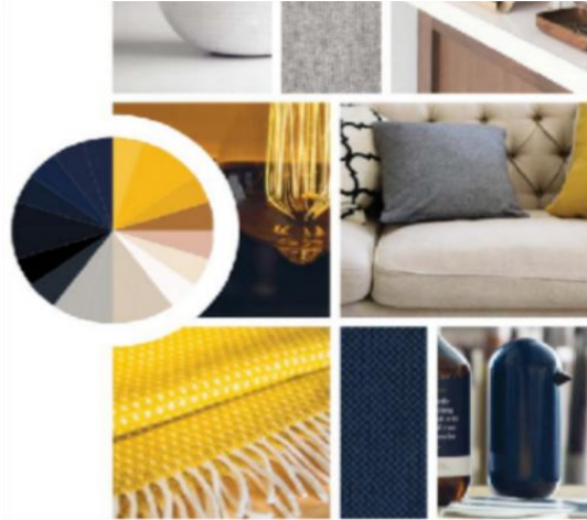
Gambar 3. Palette Color Hotel Voco Bandung

Konsep Warna " Yellow Thread " dapat dilihat sebagai teori kesinambungan visual dalam desain interior branding , yaitu suatu cara yang memanfaatkan satu elemen utama sebagai pengikat identitas dalam berbagai ruang yang berbeda (Ihg, 2018). Dalam merek Voco, warna kuning bertindak sebagai elemen yang selalu ada, berfungsi mirip seperti benang identitas merek yang berani dan unik ini diterapkan secara fleksibel melalui berbagai elemen hotel yang lebih halus, termasuk rincian interior, aksesoris warna, pencahayaan, dan elemen dekoratif. Penerapan tersebut juga didasarkan pada tiga pilar utama yaitu Voco come on in , Me time , dan Voco life sebagai dasar untuk suasana yang telah dirancang di dalam ruangan.